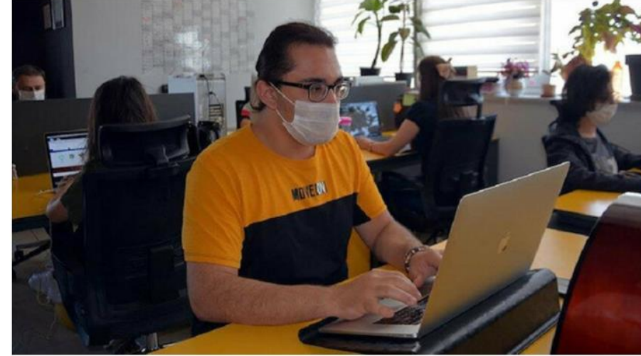
Gaziantep'te yaşayan mühendisler destek aldı.

Haber Merkezi · 08 Temmuz 2020, 10:19 · Son Güncelleme: 08 Temmuz 2020, 10:36 · AA